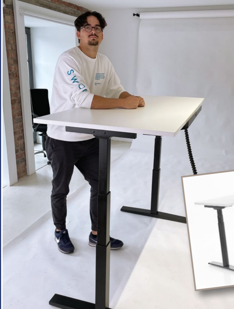
INWERK IMPERIO LIFT