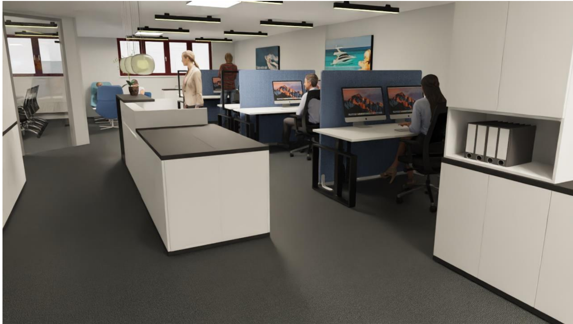
Empfangstheken-Verlängerung durch Stauraum